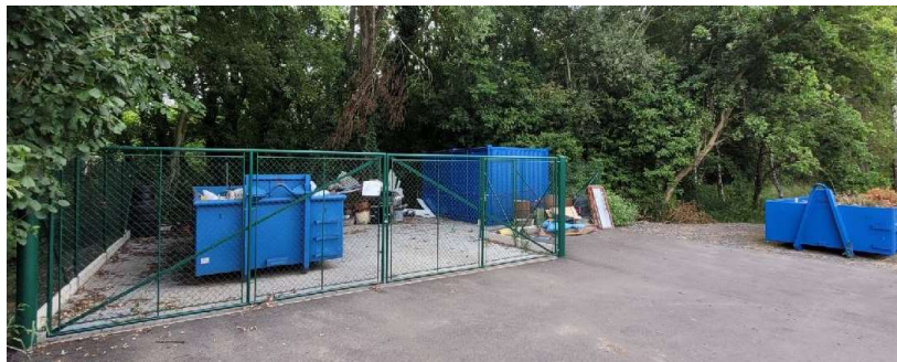
Sběrné místo č.4 U místního rybníku

1 x velkoobjemový odpad 2 x nebezpečný odpad 1 x bioodpad 1 x papír 1 x plast Otevřeno poslední sobota v měsíci 9-11 hod Bioodpad denně od 1.4 do 30.11