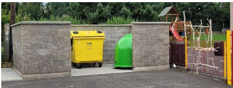
Sběrné místo č.3 U mateřské školy