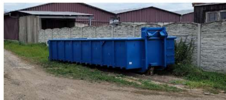
Sběrné místo č.5 U firmy Agros

Otevřeno poslední sobotou v měsíci 9-11 hod Bioodpad denně od 1.4 do 30.11