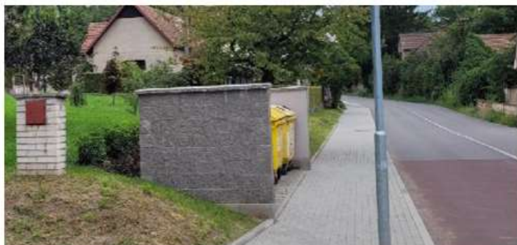
Sběrné místo č.2 U místního obchodu

2 x plasty 1 x bílé sklo 1 x barevné sklo 1 x olej