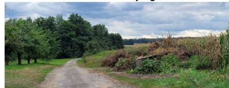
Místo pro uložení ořezu větví "Na Průhoně"

1 x bioodpad kontejner je přistaven od 1.4 do 30.11