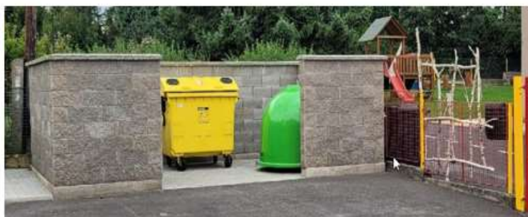
Sběrné místo č.3 U mateřské školy