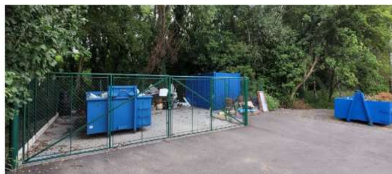
Sběrné místo č.4 U místního rybníku

1 x velkoobjemový odpad 2 x nebezpečný odpad 1 x bioodpad