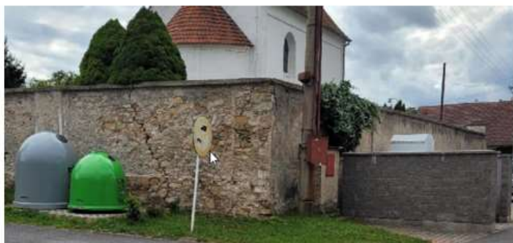
Sběrné místo č.1 U obecního úřadu

1 x papír 1 x plasty 1 x barevné sklo 1 x kovy 1 x textil 1 x kontejner komunální