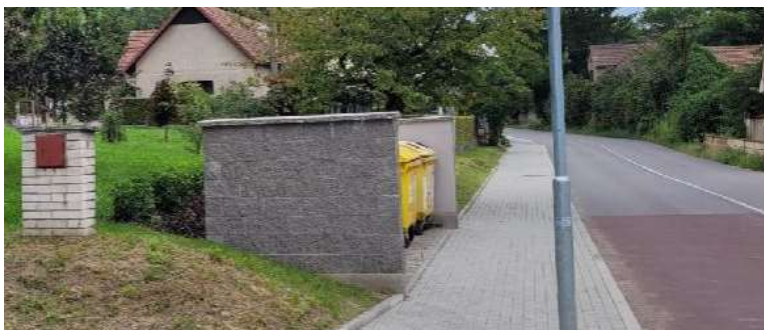
Sběrné místo č.2 U místního obchodu

2 x plast 1 x bílé sklo 1 x barevné sklo 1 x olej