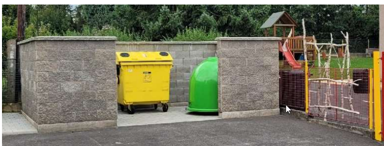
Sběrné místo č.3 U mateřské školy