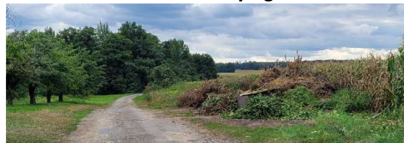
Místo pro uložení ořezu větví "Na Průhoně"

1 x bioodpad kontejner je přistaven od 1.4 do 30.11