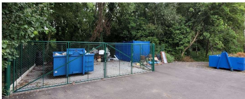
Sběrné místo č.4 U místního rybníku

1 x velkoobjemový odpad 2 x nebezpečný odpad 1 x bioodpad 1 x papír 1 x plast Otevřeno poslední sobota v měsíci 9-11 hod Bioodpad denně od 1.4 do 30.11