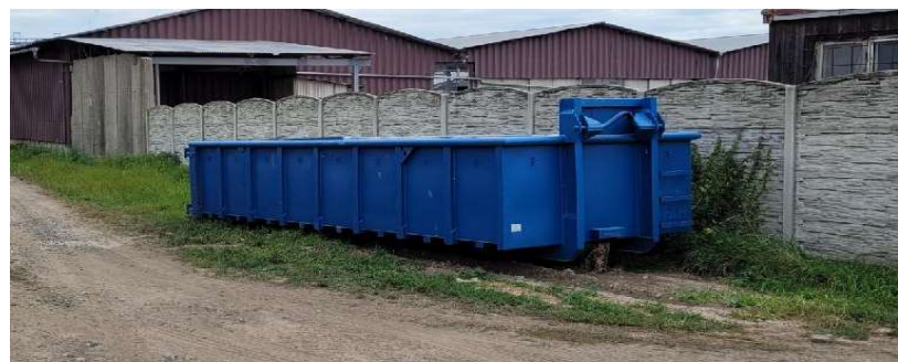
Sběrné místo č.5 U firmy Agros

1 x velkoobjemový odpad 2 x nebezpečný odpad 1 x bioodpad 1 x papír 1 x plast Otevřeno poslední sobota v měsíci 9-11 hod Bioodpad denně od 1.4 do 30.11