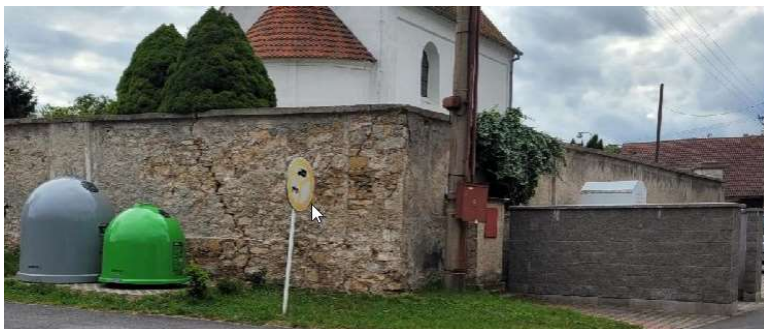
Sběrné místo č.1 U obecního úřadu

2 x papír 1 x plasty 1 x barevné sklo 1 x kovy (charita) 1 x textil 1 x kontejner komunální